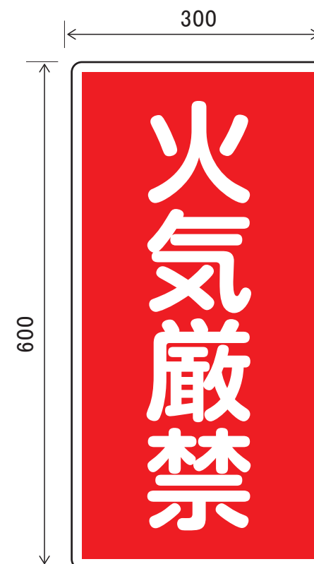
③火気厳禁の掲示板

塩ビ樹脂製 穴なし (ラミネート圧着加工) 赤地に白文字 (参考型式 / 品番=KHT-1R)